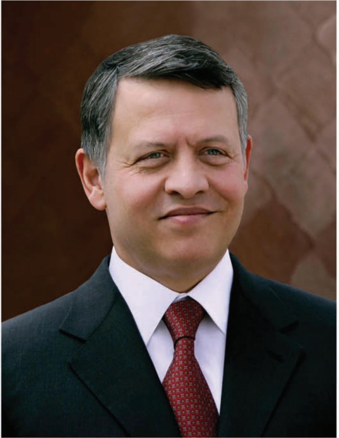
حضرة صاحب الجلالة الهاشمية الملك عبدالله الثاني بن الحسين المعظم